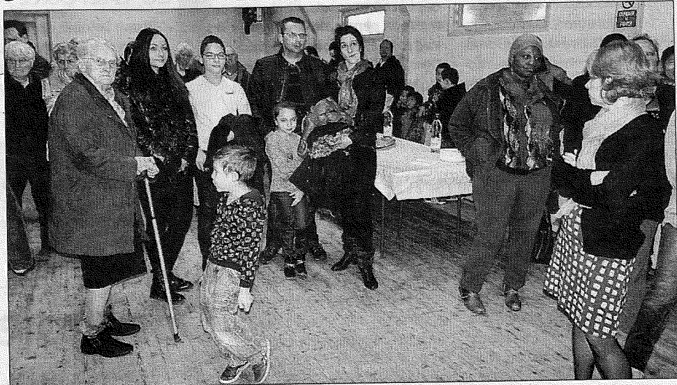
► Une cinquantaine de Corniliens ont assisté à la cérémonie des vœux l'autre dimanche soir. fants scolarisés à Boisemont.

Il a ensuite dressé un rapide bilan de l'année écoulée avec la création d'un site Internet, la suppression de la part communale sur la facture d'eau faite conjointement avec Veolia permettant à chaque foyer une réduction de 50€ par an, le remplacement des abribus sauf un appartenant à la commune, cela à coûté zéro étant pris en charge par une entreprise de publicité, des travaux en cours sur l'église au niveau du clocher et drainage autour de celle-ci, une participation aux frais de cantine pour les en-